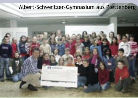
Albert-Schweitzer-Gymnasium aus Plettenberg

Alt-Computer für Vereinsarbeit Die Spedition Kühne & Nagel aus Hannover führte eine Mitarbeiteraktion durch. Die Beschäftigten konnten die hauseigenen ausrangierten PC's erwerben. Es wurde ein Verkaufserlös von 1.070 EUR erzielt, welcher nun unserer Vereinsarbeit zu Gute kommt.