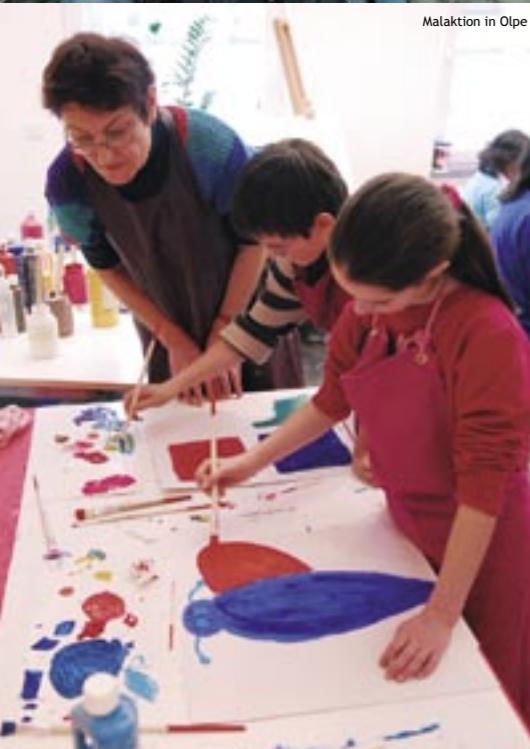
Malaktion in Olpe

„Wir möchten, dass die Inhalte der Kinderhospizarbeit so bekannt werden, wie die Arbeit im Kindergarten ...“