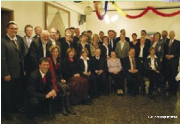
Bundespräsident Horst Köhler