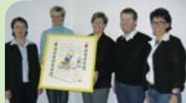
Kreativstube aus Olpe