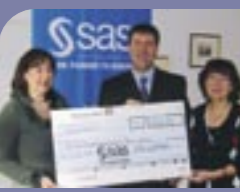
SAS aus Heidelberg