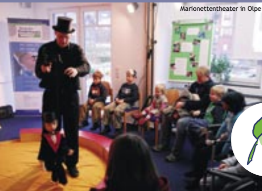
Marionettentheater in Olpe

„Wir möchten, dass die Inhalte der Kinderhospizarbeit so bekannt werden, wie die Arbeit im Kindergarten ...“