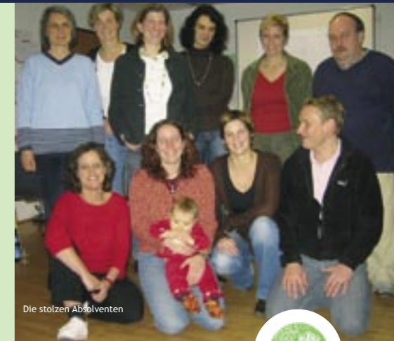
Die stolzen Absolventen

Anruf aus dem deutschen Festnetz kostet 20 Cent 5 € oder 10 € spenden!