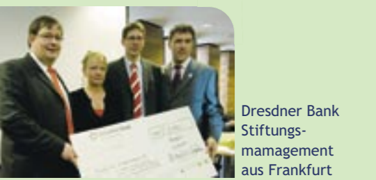
Dresdner Bank Stiftungsmanagement aus Frankfurt