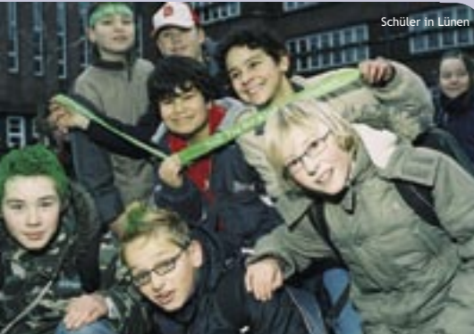
Schüler in Lünen